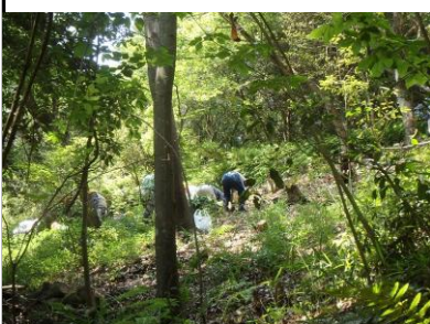
シリブカガシ林 林床整備