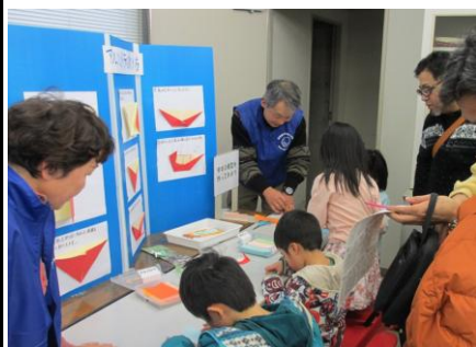
サカイエンス出展<アルソミトラ折紙>