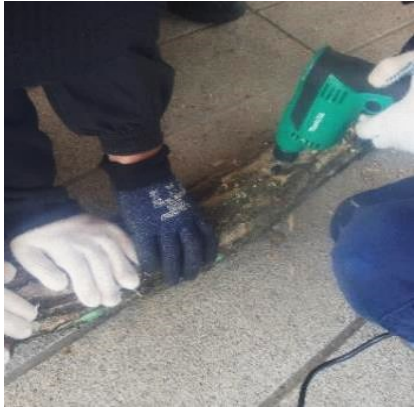
シイタケの菌打ち(ドリルで孔開け)